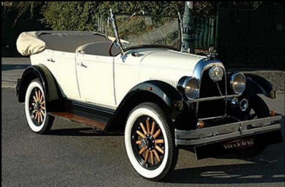
WHIPPET TORPEDO del 1929 WHITE & BLACK SERVIZIO NOZZE CON AUTISTA