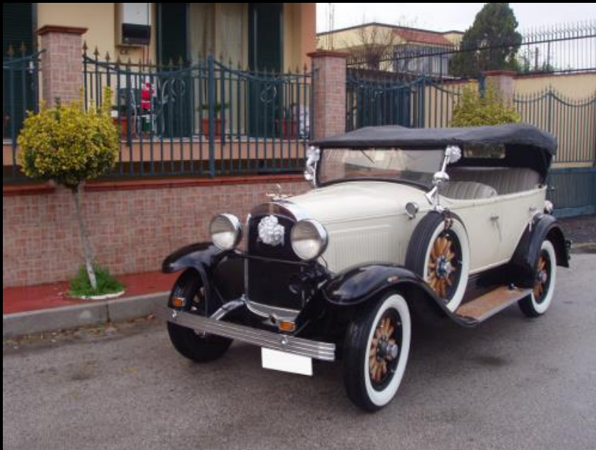
WHIPPET TORPEDO del 1929 WHITE & BLACK SERVIZIO NOZZE CON AUTISTA