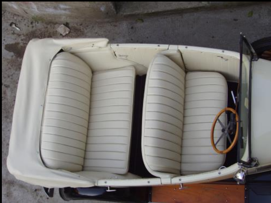
WHIPPET TORPEDO del 1929 WHITE & BLACK SERVIZIO NOZZE CON AUTISTA