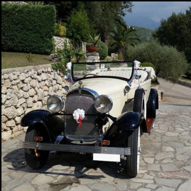
WHIPPET TORPEDO del 1929 WHITE & BLACK SERVIZIO NOZZE CON AUTISTA