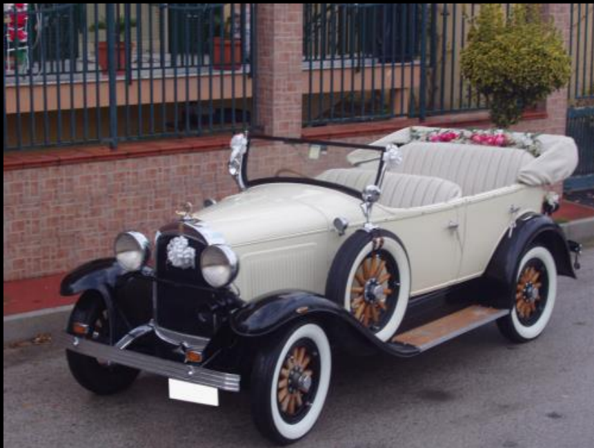
WHIPPET TORPEDO del 1929 WHITE & BLACK SERVIZIO NOZZE CON AUTISTA