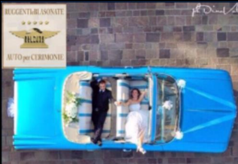
PONTIAC CABRIOLET SERVIZI IN TUTTA ITALIA CON AUTISTA