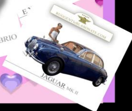
JAGUAR MK II