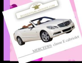
MERCEDES classe E cabriolet