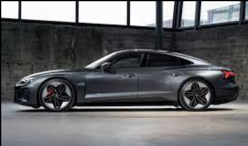
AUDI E-TRON GT 640CV SERVIZIO SPOSI CON AUTISTA