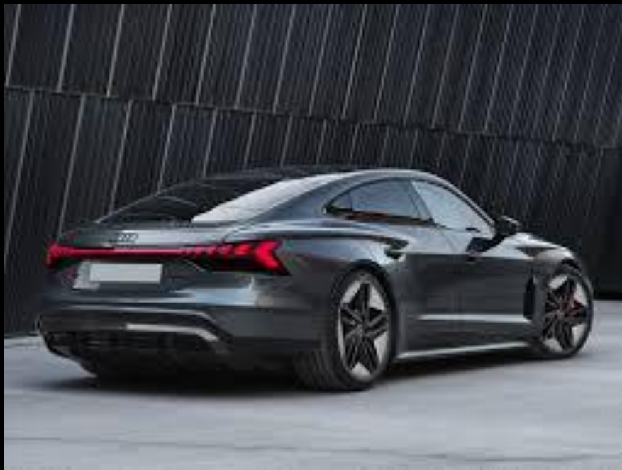
AUDI E-TRON GT 640CV SERVIZIO SPOSI CON AUTISTA