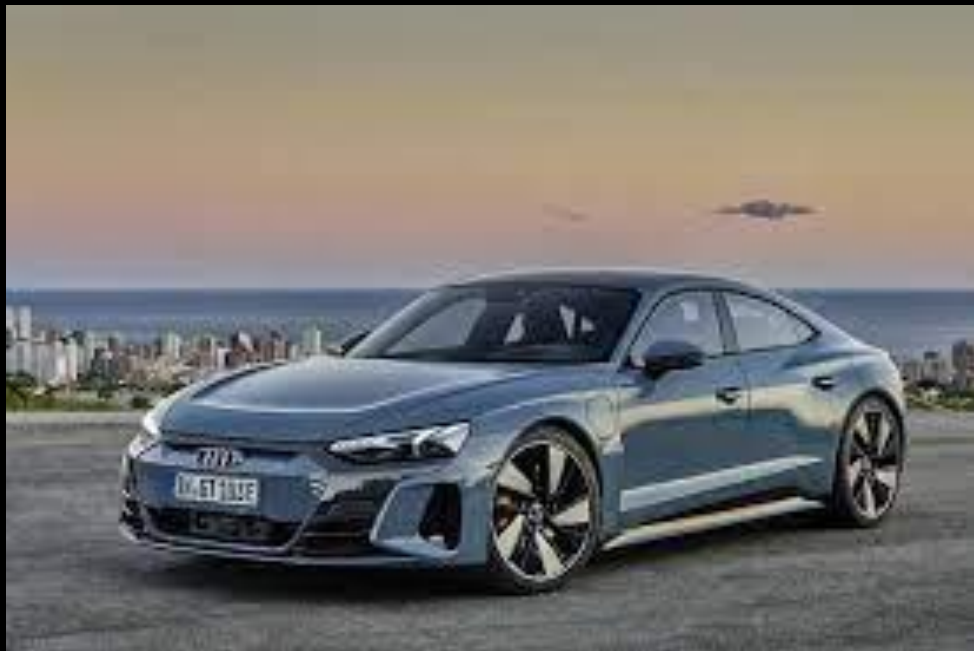
AUDI E-TRON GT 640CV SERVIZIO SPOSI CON AUTISTA