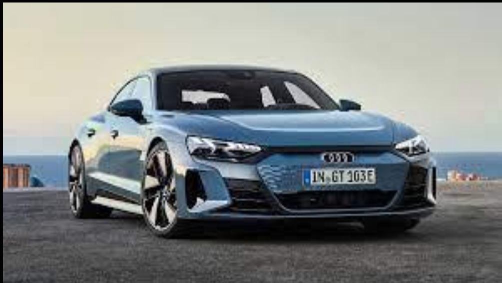
AUDI E-TRON GT 640CV SERVIZIO SPOSI CON AUTISTA